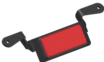
SUPPORTO CATADIOTTRO REGOLABILE UNIVERSALE GAM001.06.0010